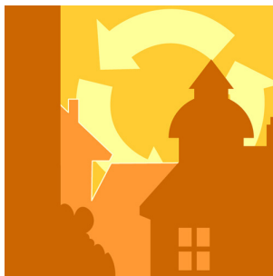
God bebyggd miljö