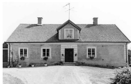
Trädgårdsmästarebostaden på 1970-talet.

Görväln omnämns för första gången år 1478, i samband med ett markbyte. År 1659 ingick ägarinnan Elsa Elisabeth Brahe ett avtal med friherren Axel Sparre, där han åtog sig att "låta uppföra ett hus av gotlandssten". Även flyglarna är från 1600-talet, medan de svängda paviljongerna kom till 1763. På Görväln finns även arbetarbostäder, ekonomibostäder och andra byggnader bevarade.