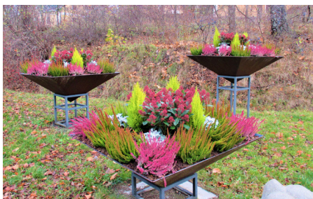
Planteringar vid Görväln.

Görvälns gård ligger mitt i ett naturreservat. Här finns både ett arboretum och en skulpturpark. Gårdsmiljön är välbevarad, med byggnader från fyra sekler, där huvudbyggnaden och flyglarna utgör blickfånget.