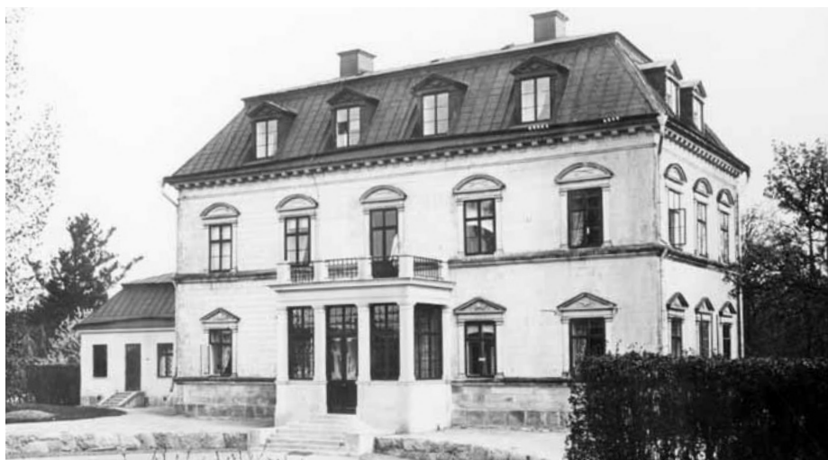
Görvälns slott i början av 1900-talet.