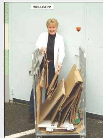
En rullhäck för wellpappförpackningar spar plats i behållaren för grovavfall.

Wellpapp fyller snabbt behållaren med "luft". Se istället till att wellpappförpackningar går till återvinning med en fastighetsnära hämtning, se s. 6.