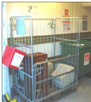
Behållare för stor elektronik