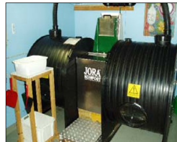
Inomhuskompost på BRF Växstolen

Drygt en tredjedel av hushållssoporna är komposterbart. Att kompostera är att göra en god insats för miljön samtidigt som näringsrik trädgårdsjord framställs. Varje hushåll som komposterar erhåller en reducering på avfallsavgiften. Dessutom behövs färre sopkärl vilket minskar såväl behandlingsavgift som tömningsavgift. För att börja kompostera ska en anmälan om kompost lämnas till kommunens miljö- och hälsoskyddsavdelning. Särskilda papperspåsar ska användas i insamlingsystemet.