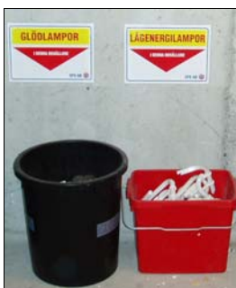
Behållare för lågenergi- och glödlampor