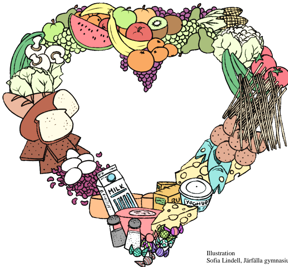
Illustration Sofia Lindell, Järfälla gymnasium

I lunchen ingår ett stort salladsbord, dressing, bröd, bordsfett och mjölk