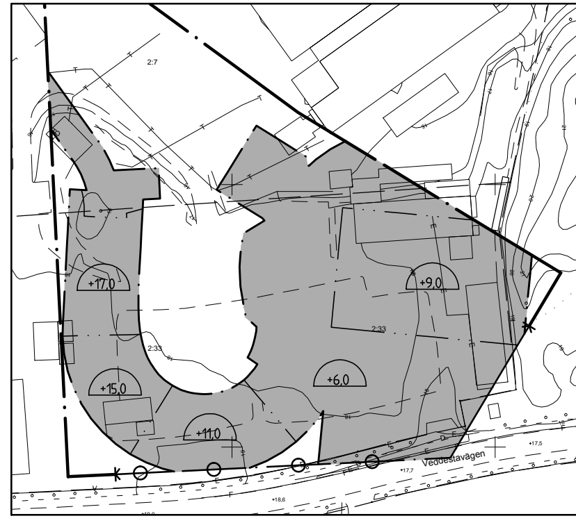
Plankarteutsnitt: skyddszon för tunnelbana och schakt djup Skala 1:2000 (A2)