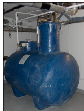
Kvarn till tank