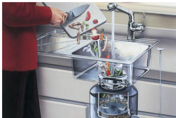
Kvarn till VA-nätet