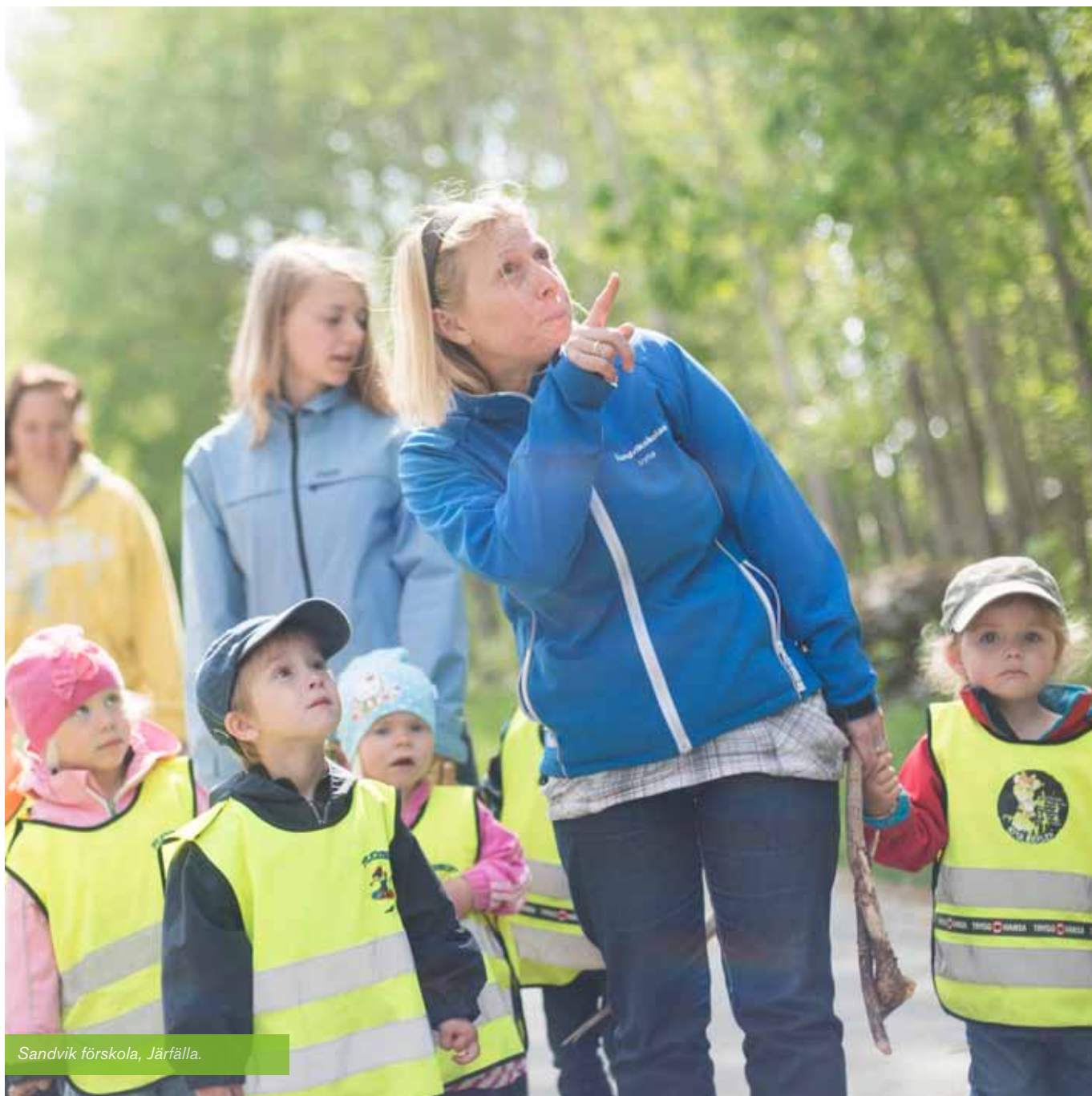
Sandvik förskola, Järfälla.