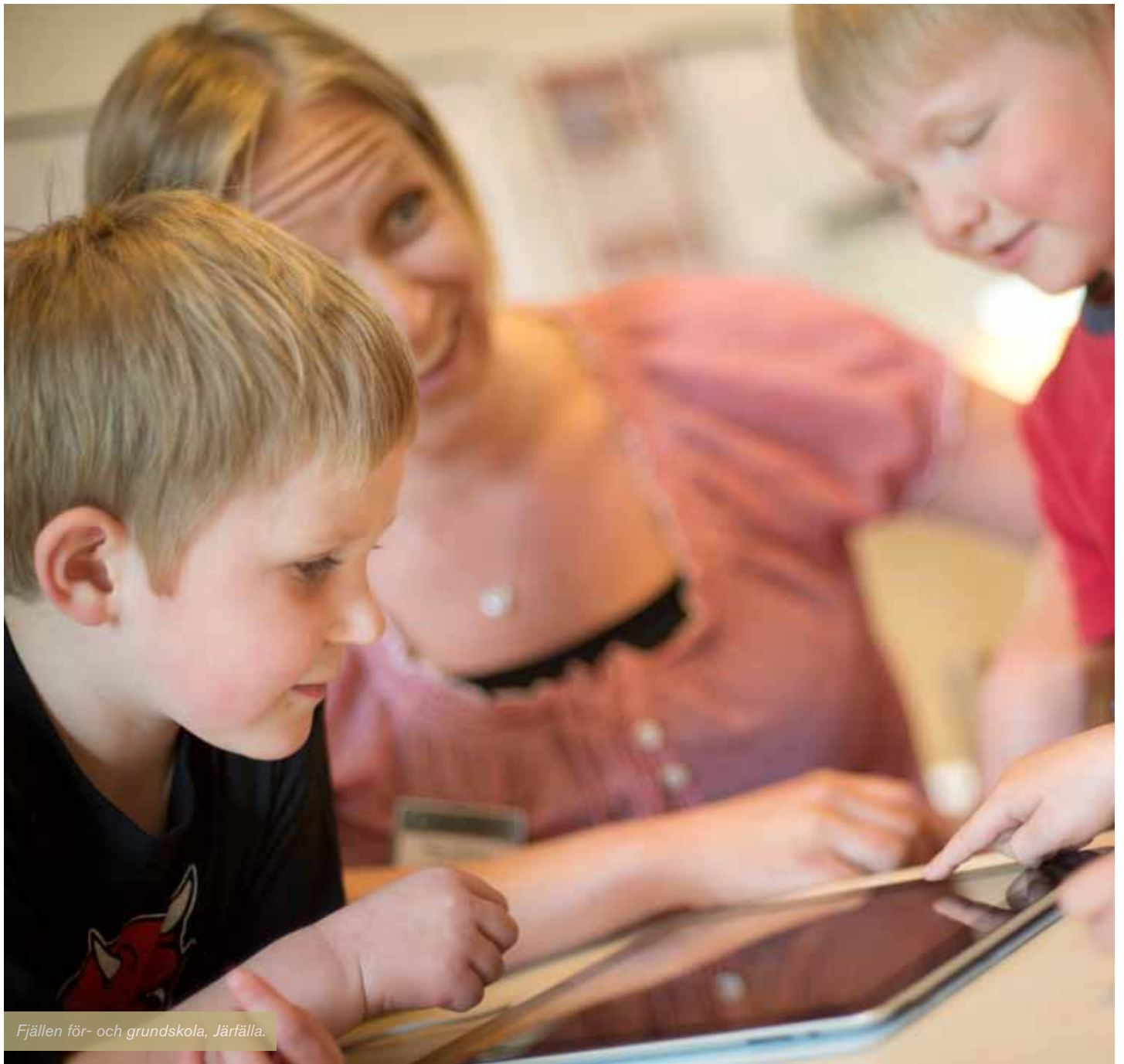
Fjällen för- och grundskola, Järfälla.