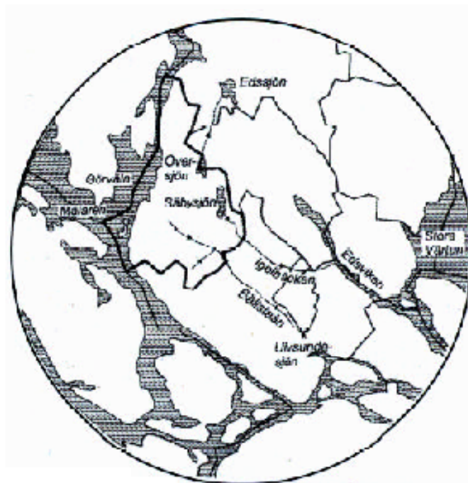
Sjöar och vattendrag i Järfälla med omgivning.

För mer info se www.norrvatten.se/Dricksvatten