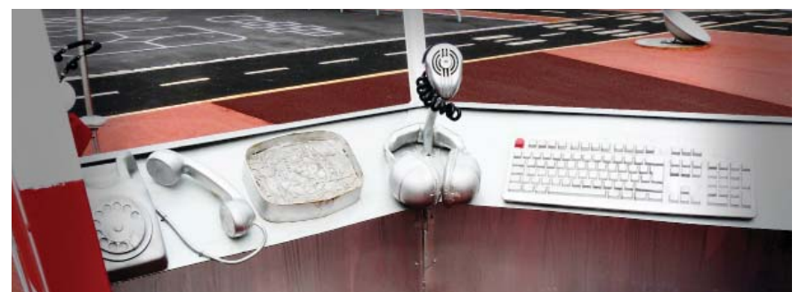
Kontrollpanel i flygledartornet.

Lekplatsen har utformats med inspiration från flyget med hopp lek, landningsbanor och specialdesignade lekredskap - ett flygledartorn, en tankstation och flygplan. Lekplatsen belyses kvällstid med spotlights och lanternor längs landningsbana. Lekplatsen angränsar till naturreservat i norr och Barkarbystaden i söder.