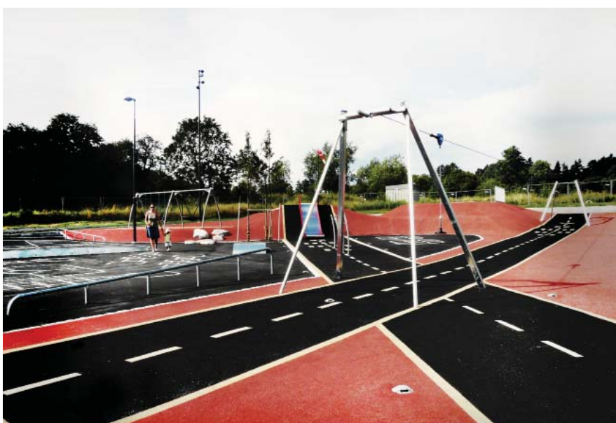
Landningsbanor i gummi, skatelek, hoppagar, streetbasket.