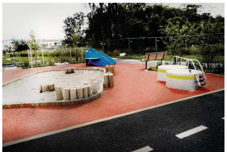
Lek för de yngsta, sandlek, en liten rutsch och snurrkoppar.