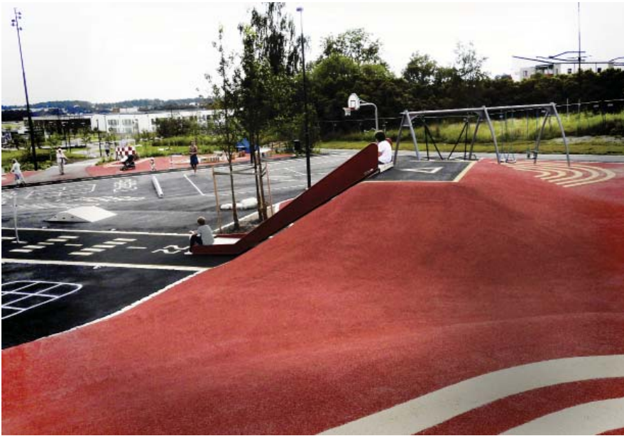
Gummikullar med studsmattor att springa över och en stor släntrutschbana.