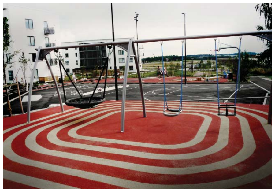
Gunglek för stora och små.