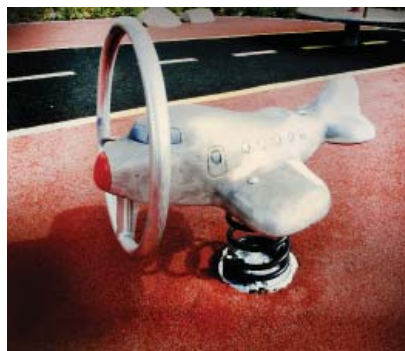
Specialdesignad tankstation och flygplan.