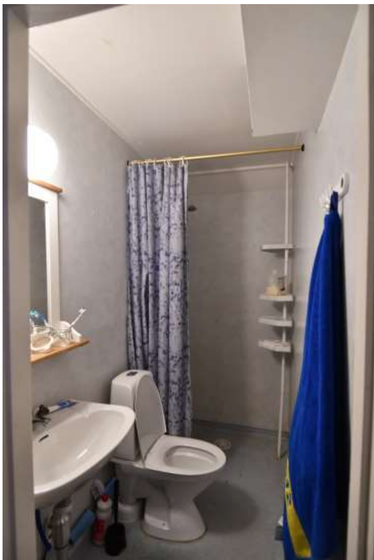
Våtrummen är mer sentida med väggar och golv med plastmatta.