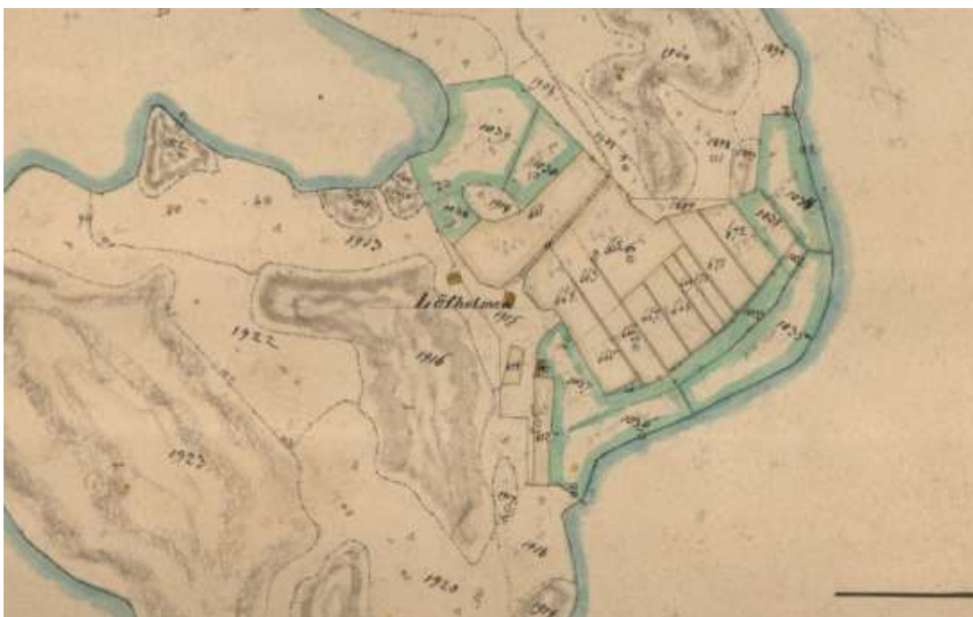
Arealavmätning från 1866, de två södra byggnaderna på denna karta kan även följas i Formsök där de är angivna som "husgrunder".