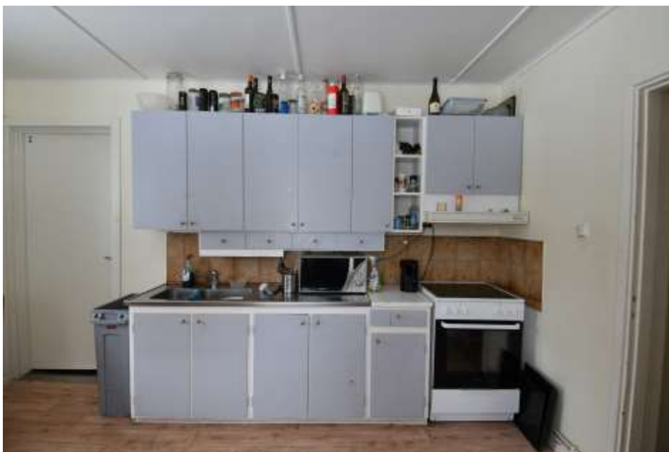
Köksinredningen från 1951 är delvis bevarad, bänkskåp med diskbänk är från moderniseringen, medan överskåp och elspisen är sentida.