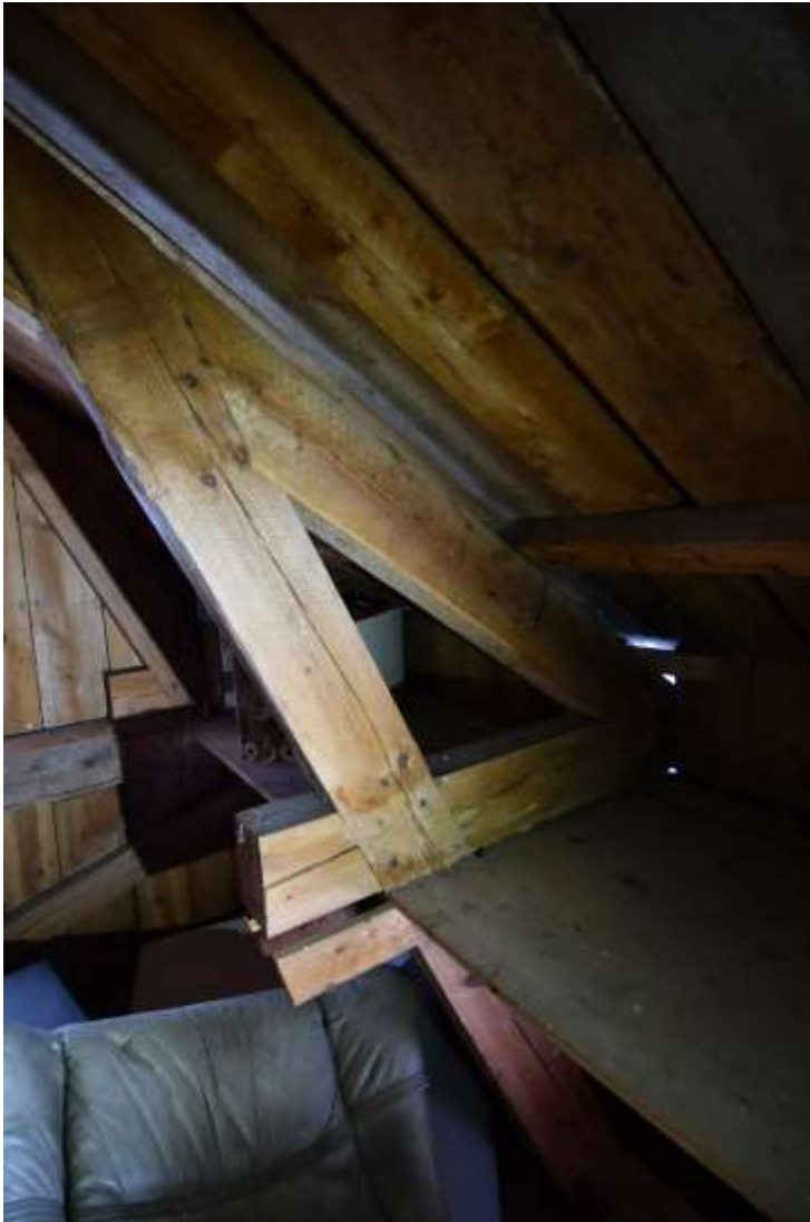
Takstol av cirkelsågat virke, sammanfogat med halvningar och bladning med lax. Spikat med maskintillverkad spik.

Det finns dock en timmerstomme synlig under trappan till vinden. Man kan tydligt se ålderskillnaden mellan timran och trappans undersida. Denna är av delvis bilat timmer.. Timran består av delar av olika ålder och vissa partier har spår av äldre bemålning. Knutarna är väldigt täta. Timran går upp till vindsbjälklaget, över det är ytterväggarna i ramverk i formatsågat virke. Även takstolen och underlagstalet är av formatsågat (cirkelsågat) virke. Samlingarna med laxhak och halvningar är spikade med maskintillverkad spik.