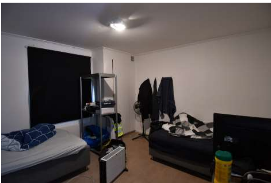
I rummen är materialerna generellt moderna. Taken på vindsplanet är vävspända och pappklädda.