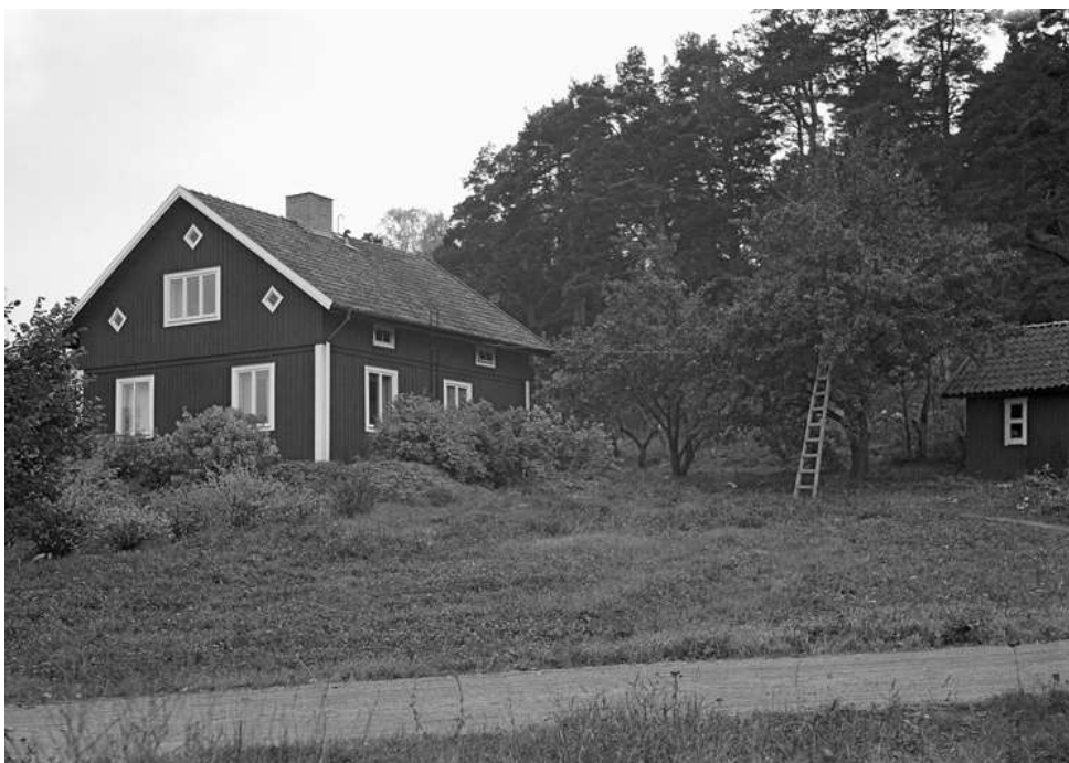
I Järfälla kommuns bildarkiv finns ovanstående bild fotograferad år 1951. Fotograf var Artur Jolin.