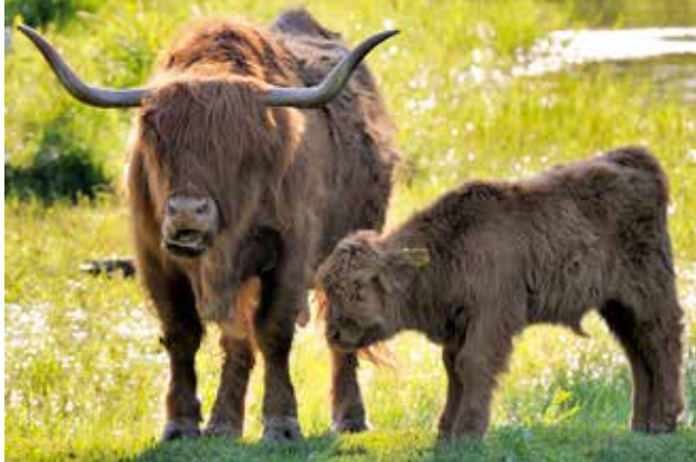
HIGHLAND CATTLE.