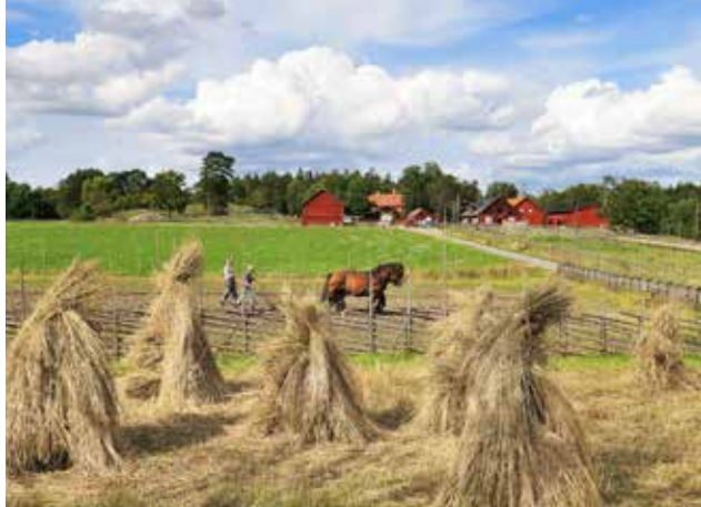
KULTURLANDSKAP VID BÖGS GÅRD.

de andra gårdarna antas ha varit etablerade under senare delen av järnåldern. På 1700- och 1800-talet fanns många torp som tillhörde de större gårdarna. Flera torpplatser har än idag synliga spår från tiden då människor bodde där.