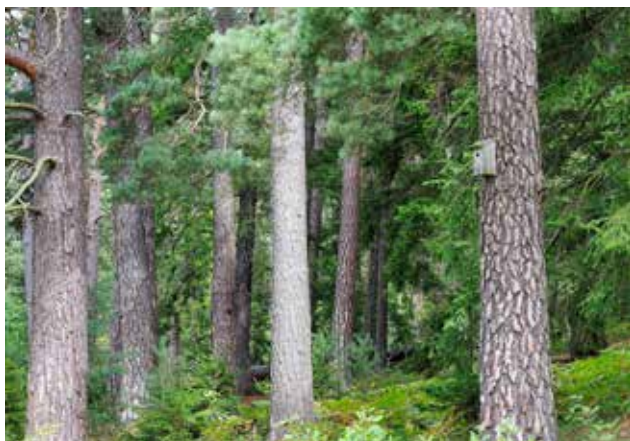
BARRSKOG MED ÄLDRE TALLAR.

En viktig del i reservatets löpande skötsel är jordbruket som sätter sin prägel på stora delar av Järvafältet. Områdena betas framför allt med nötkreatur men även med hästar och får. Varje sommar slås några mindre ängar med lie.