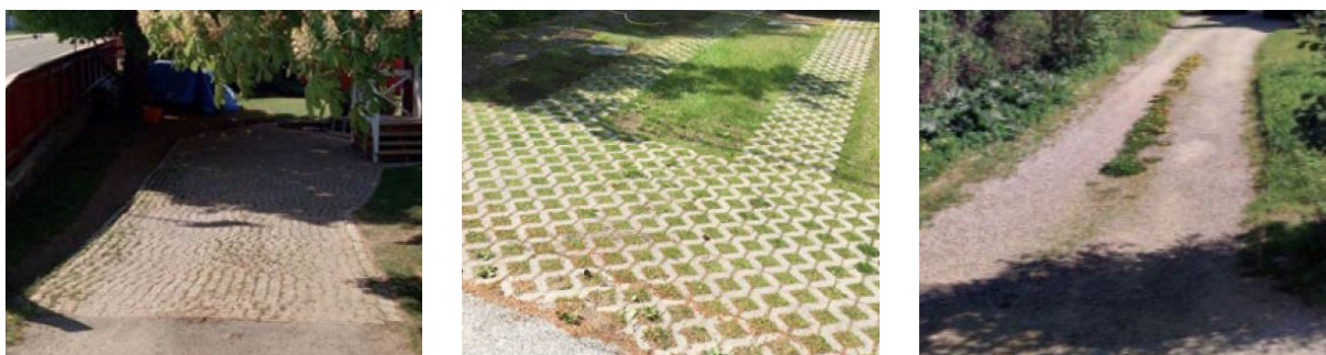
Figur 5: Exempel från Järfälla på genomsläpplig markbeläggning för biluppställning på kvartersmark

För att se till att en stor del av marken inom planområdet inte hårdgörs regleras andelen mark som ska vara genomsläpplig till 25 % i plankartan. Den nya detaljplanen medger ingen ytterligare bygggrävt. Föreslagen dagvattenhantering förbättrar därmed möjligheterna att MKN nås för Ballstaån då dagvattenhanteringen har förbättrats för planområdet.