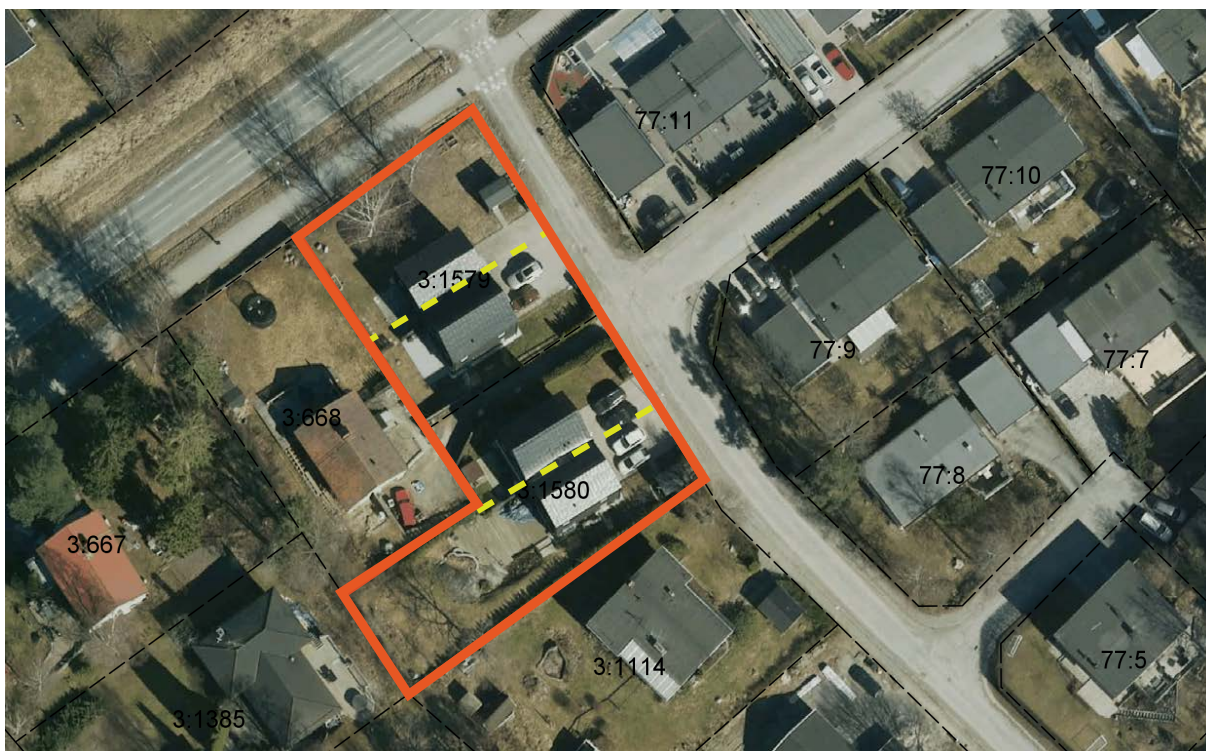
Figur 2: Markering av planområdet och hur fastigheterna kan avstyckas med detaljplanen.