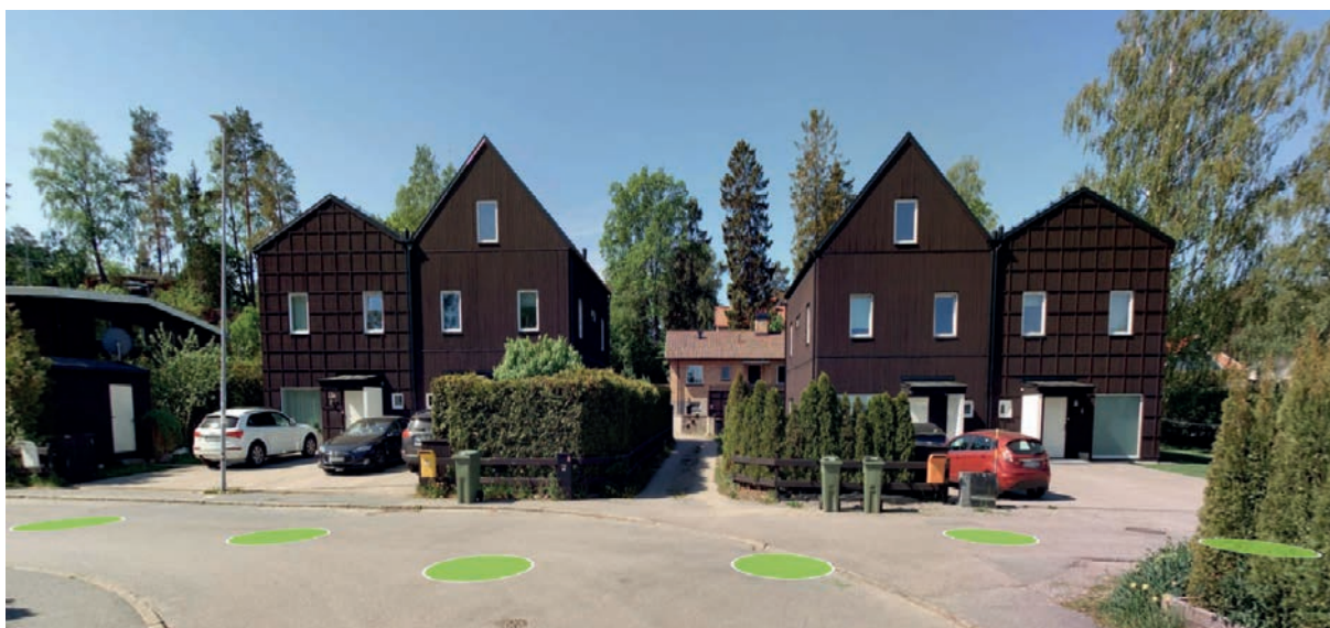
Figur 3: De befintliga parhusen i planområdet, på bilden syns även skaftvägen till Skälby 3:668.