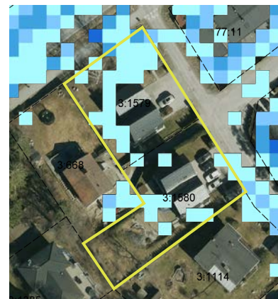
Figur 4: Översvämningsrisk vid ett klimatanpassat hundraårsregn.

Planområdet visar måttliga strålningsnivåer. Planförslaget bedöms inte leda till skadlig exponering för radon under förutsättning att bostäder radonanpassas. Byggnation av nya bostäder ska därför föregås av en radonmätning