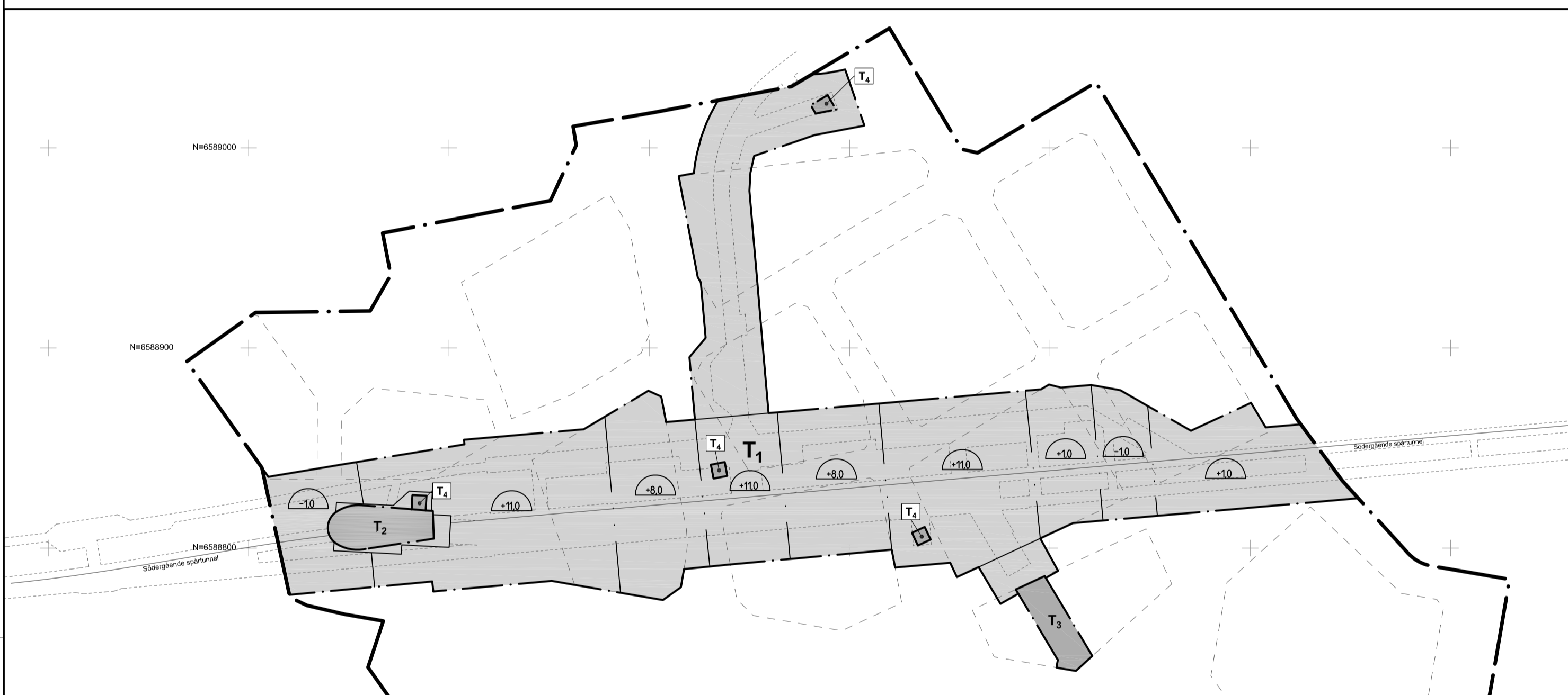
Plankartetsnitt: skyddszon för tunnelbanan med avgränsning och schaktdjup