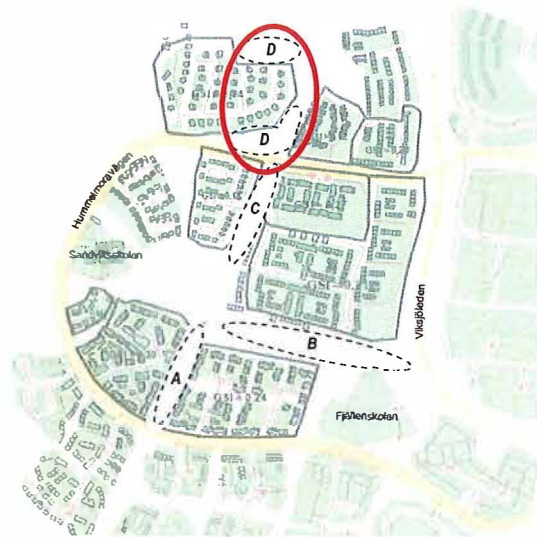
Delområde D är den tredje detaljplaneetappen av tre i Viksjö. De andra två etapperna är för respektive delområde A - C och B. Detaljplaneområdets gränser kommer att studeras vidare som en del av planarbetet.