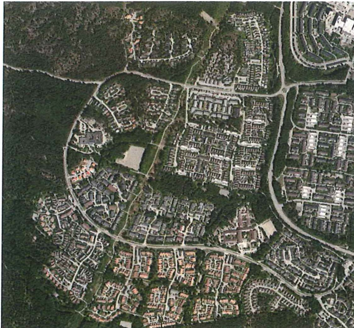
Översiktlig bild över området.

kopplar ihop och ansluter till allmänna platser som skolor och lek- och aktivitetsplatser. Ett stenkast västerut finns Görvälns naturreservat.