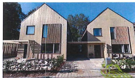
Exempel på ungefärlig storlek av friliggande småhus, parhus och friliggande småskaliga flerbostadshus i form av stadsvillor, som planförslaget avser.