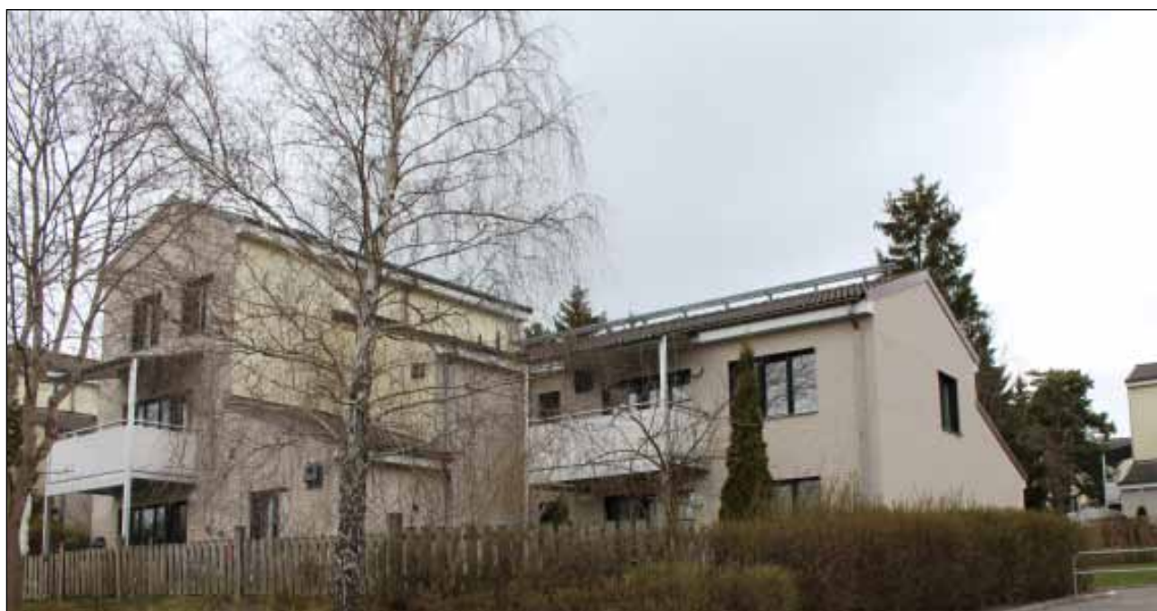
Flerfamiljshus vid Hummergränd

De bilfria gårdarna är planterade med buskar men enstaka träd har också sparats vid exploateringen.