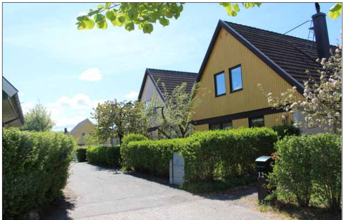
Villor vid Ålvägen

Områdets huvudsakliga karaktär bör bevaras, vilket innebär att man bör slå vakt om byggnadernas utformning, färgsättning och materialval.