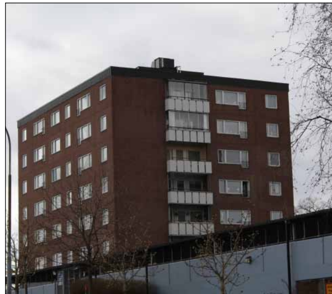
Punkthus vid Axvägen

Inga förslag till restriktioner, då några större förändringar knappast är aktuella.