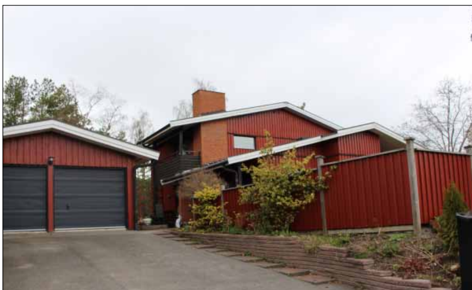
Villa vid Skulpturvägen