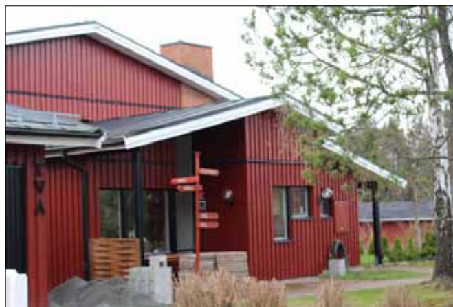
Villa vid Skulpturvägen

Genom att utbyggnader ingår som en del av det arkitektoniska formspråket är det möjligt att göra mindre tillbyggnader utan att karaktären går förlorad. Förutsättningen är dock att dessa utförs liknande de befintliga och att de harmoniserar med byggnaden.