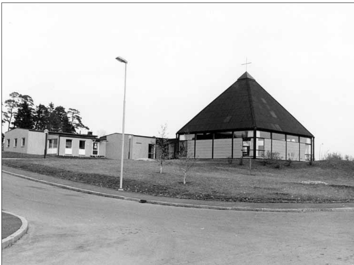
Viksjo kyrka.