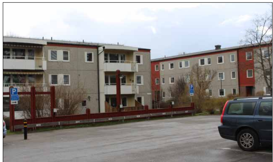
Lamellhus vid Axvägen