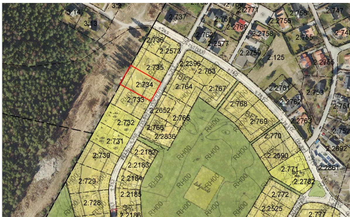
Figur 5: Utdrag ur gällande detaljplan med fastigheten Jakobsberg 2:734.

Den nu gällande stadsplanen är från 1965 och tillåter friliggande egnahems hus på stora fastigheter (minst 900 kvm).