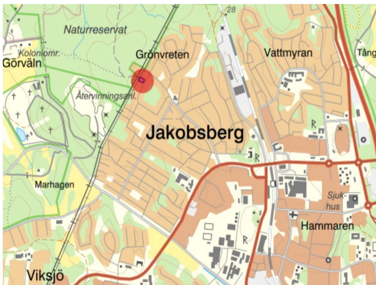
Figur 1: Orienteringskarta med planområdet markerat, fastigheten Jakobsberg 2:734.

Planförslaget består av plankarta med bestämmelser. Till planen hör även denna planbeskrivning.