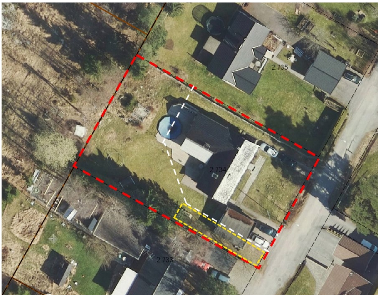
Figur 3: Fastigheten Jakobsberg 2:734 är 1526 kvm. Den vita linjen illustrerar preliminär ny fastighetsgräns efter avstyckning. Varje tomt ska vara minst 700 kvm. Den gula linjen illustrerar den föreslagna skaftvägen

Kommunen, genom samhällsbyggnadsavdelningen, ansvarar för upprättande av detaljplan med tillhörande handlingar. Bygg- och miljöförvaltningen ansvarar för myndighetsutövning vid granskning av lov och anmälan. Lantmäterimyndigheten ansvarar för erforderliga fastighetsbildningsåtgärder på fastighetsägarens initiativ och bekostnad.