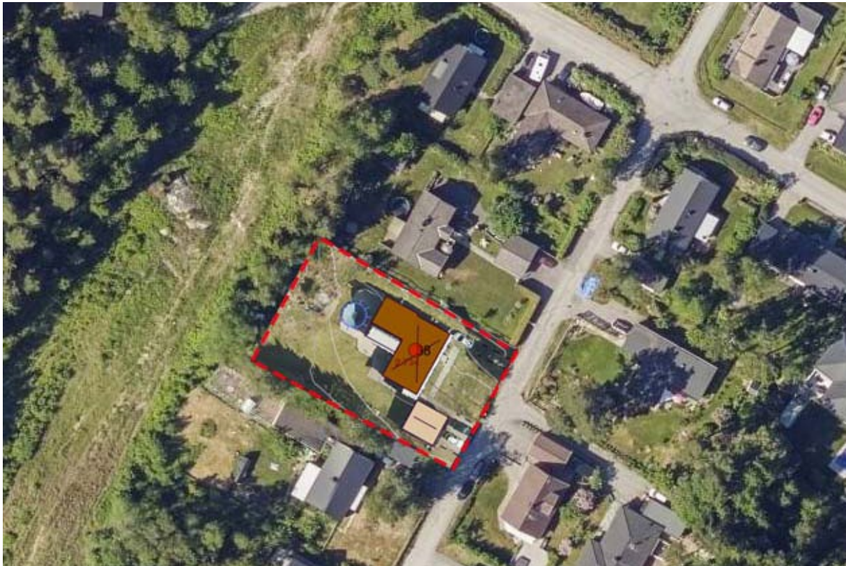
Figur 4: Ortofoto över planområdet bestående av fastigheten Jakobsberg 2:734.

Fastigheten Jakobsberg 2:734 är privatägd.