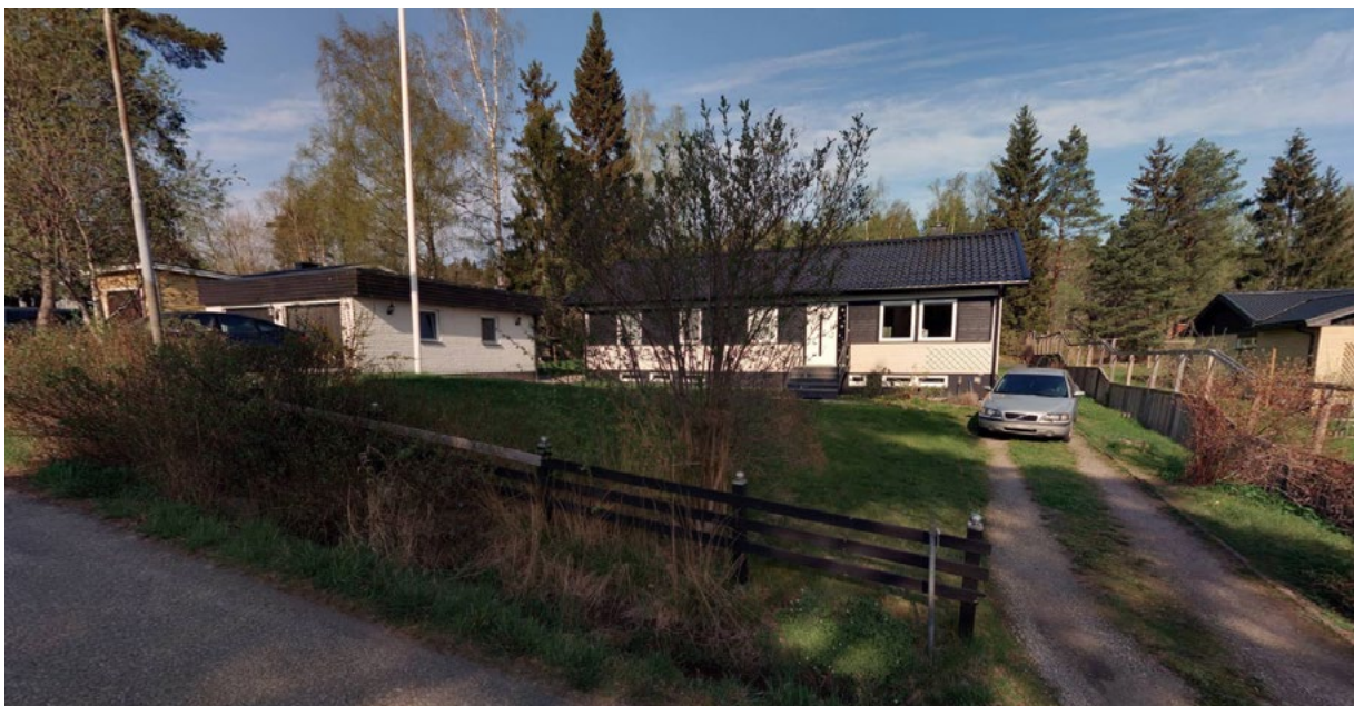
Figur 6: Befintlig bebyggelse, vy från Terrängvägen.

Planområdet ligger cirka 400 m till Vallvägens förskola. Olovslundsskolan ligger cirka en km från planområdet. I Jakobsberg drygt 2 km åt sydost finns ett stort serviceutbud med äldreboende, bibliotek, affärer och vårdcentral.