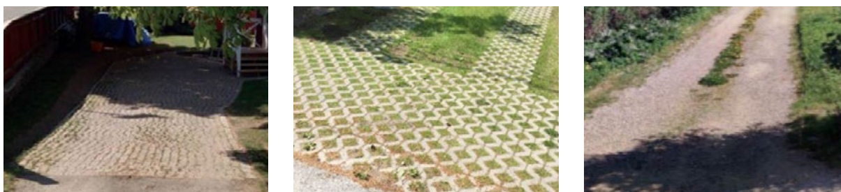
Figur 7: Exempel från Järfälla på genomsläpplig markbeläggning för biluppställning på kvartersmark

Med denna dagvattenlösning kommer inte dagvatten och föroreningar från hårdgjorda markytor att belasta recipienten Bällstaån. Dagvattenlösningen innebär att vattenkvaliteten i Bällstaån inte försämras.