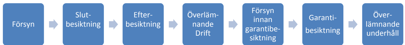
Figur 1 Besiktning av hårdgjorda ytor