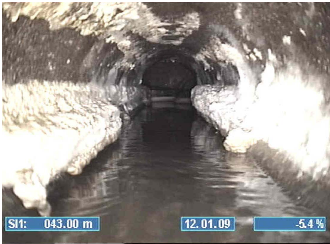
Fettavlagringar i en spillvattenledning i Järfälla år 2009.

Information och riktlinjer rörande fett och fettavskiljare i Järfälla kommun