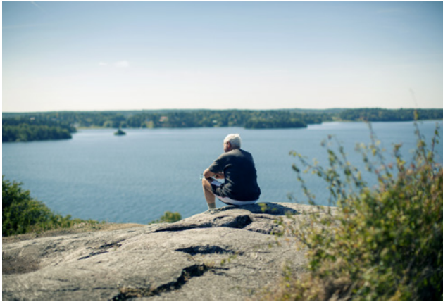
Gåseborg – en mäktig fornborg på Gåsberget, med ett växt- och djurliv som är skyddsvärt. Gåsberget har utsetts till ett Natura 2000 område.