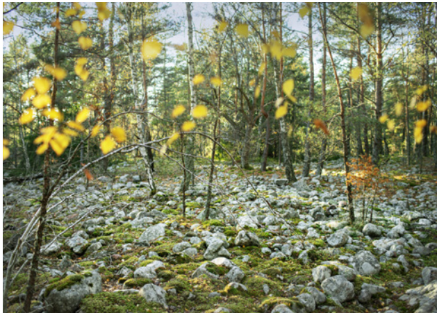
Strandvallarna med klappersten på Hummelmoraberget. Norra Stockholms största så kallade stentorg.

Görvälnområdet är ett 13 kvadratkilometer stort grönstråk mellan Järfällas bebyggelse och Mälaren. Reservatet bildades 1995 med syftet att bevara ett värdefullt natur- och kulturlandskap och ett välbesökt friluftsområde. Här finns skog med både barr- och lövträd, hällmark och öppna betesmarker med stora fristående träd. I området kan du njuta av bad, promenader, grillplatser och fågelskådning. För den aktive finns flera motionsspår och utomhusgym, två utflyktslekplatser samt goda möjligheter till svamp- och bärplockning.