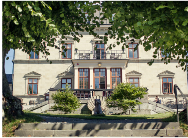
Det anrika Görvälns slott kan ses som navet av reservatet.

På Hummelmorabergets södra sluttning syns jämnstora stenar som ligger i vallar. Här har den gamla strandlinjen en gång gått. Vägorna från havet har sköljt ur finare material och skapat strandvallar av de större, tyngre stenarna.